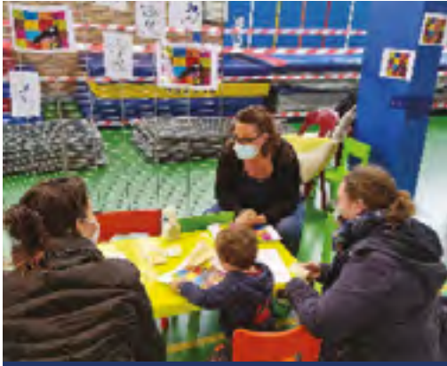
Un aperçu des animations proposées par les structures municipales telles que la crèche, la Ludothèque... ou encore l'association L'ESCAP