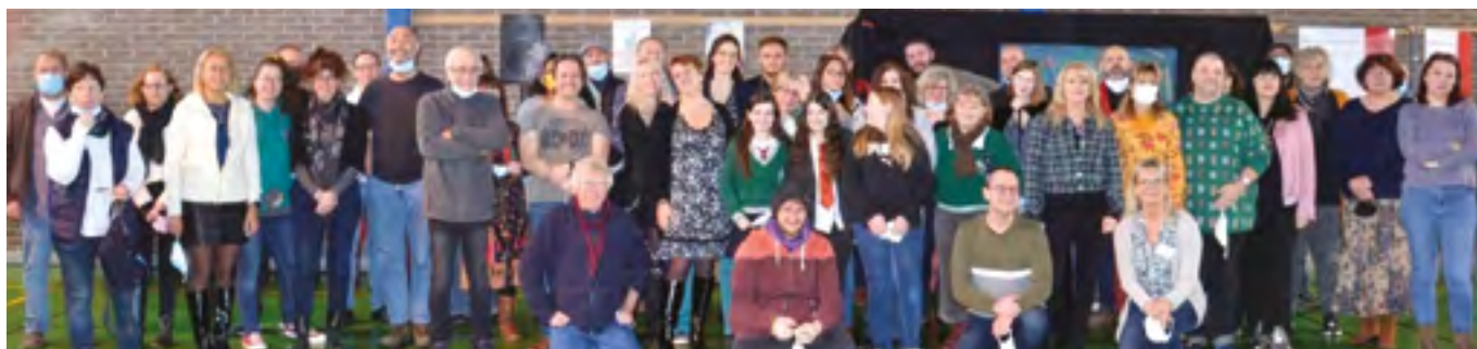
Une joyeuse équipe d'auteurs a accueilli les nombreux visiteurs (le masque a été retiré le temps de la photo)

Le mercredi, avec la complicité de la Crèche municipale, de la Ludothèque municipale, du Relais Petite Enfance, de l'Escap', des Petits Miam's, du Centre Socioculturel Adolphe Largiller, de la librairie « La P'tite Récré », de la Bibliothèque municipale Jules Mousseron et de l'école Elsa Triolet, un drôle de loup fort sympathique a accueilli les enfants et leurs familles, les accompagnant et les amusant au long des différentes animations proposées et auprès des auteurs présents.